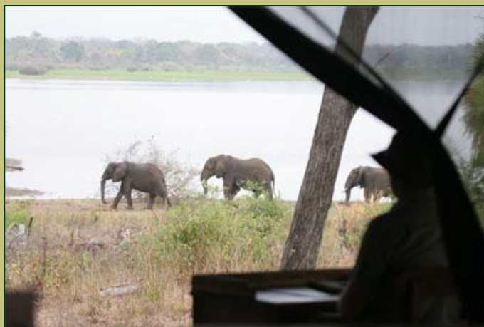
Selous, vista dalla veranda

Un soggiorno questo da vivere con tranquillità per assaporare il vero gusto dell'Africa senza fretta di passare da un parco all'altro, da un'escursione all'altra. La vita africana la si vive anche dalla propria veranda affacciati ad attendere le emozioni.